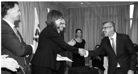
El primer premio de Tributación es felicitado por la mesa presidencial