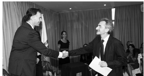
El premio de Recursos Humanos tuvo el honor de ser el último en la ceremonia de entrega

Alberto Orellana