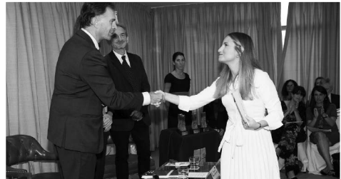
La ganadora del primer premio de Derecho Civil y Mercantil es felicitada por el presidente del ICAC