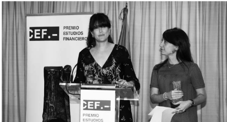
Las galardonadas de Derecho Constitucional y Administrativo, en el atril de oradores