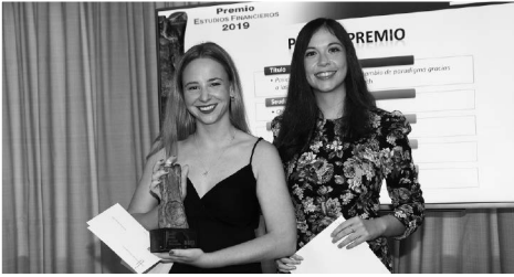
Las premiadas en la modalidad de Marketing y Publicidad fueron las primeras en recibir su estatuilla