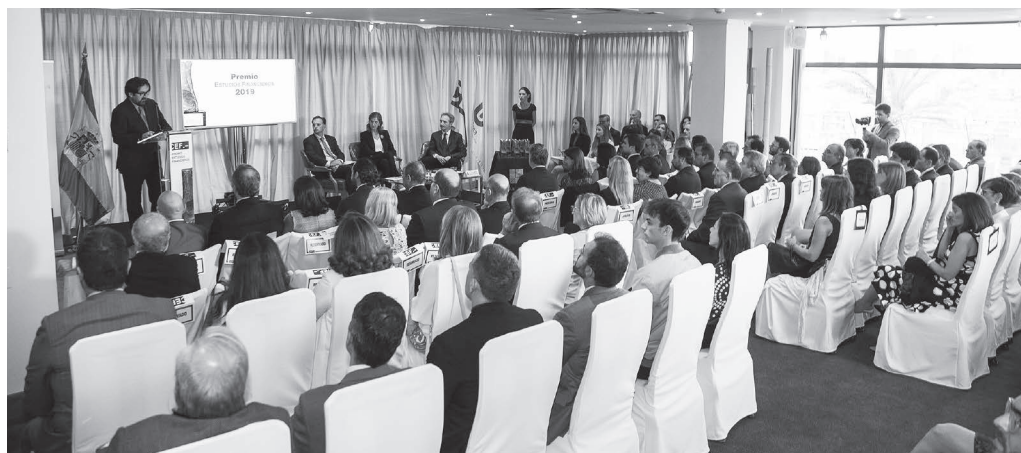
Vista panorámica del salón principal del Club Financiero Génova