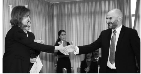
La presidenta de la UDIMA felicita al primer premio de Educación y Nuevas Tecnologías