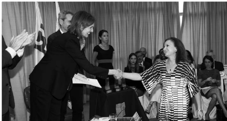
La galardonada de Derecho Laboral y Seguridad Social recoge su diploma acreditativo