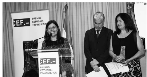
Los autores del primer premio de Contabilidad y Administración de Empresas durante su breve discurso