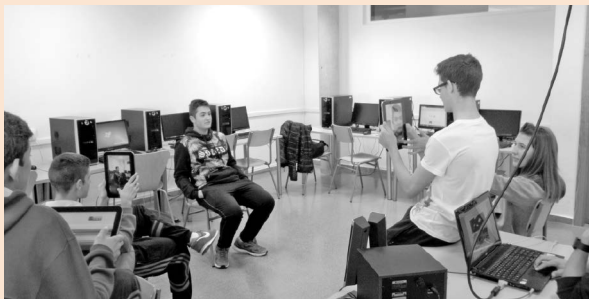
Figura 2. Actividad 1.3 (b)