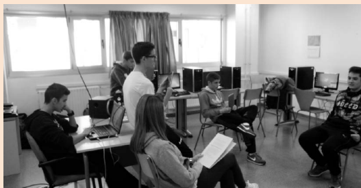
Figura 1. Actividad 1.3 (a)