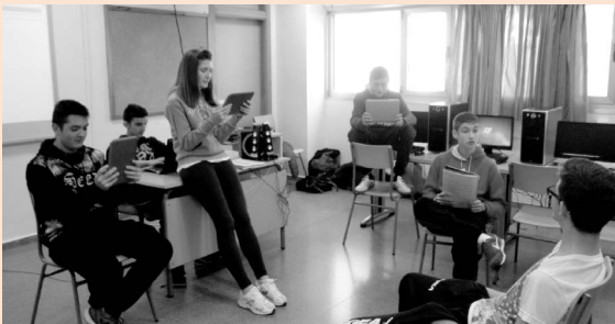
Figura 4. Actividad 1.3 (d)