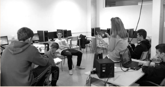
Figura 3. Actividad 1.3 (c)