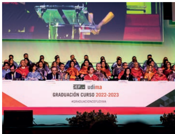
Panorámica de la mesa presidencial

Al amparo del solemne acto de graduación de alumnos de grado y máster del curso académico 2022-2023, el Grupo Educativo CEF.- UDIMA aprovechó la ocasión para escenificar también el merecido reconocimiento a los restantes ganadores del trigésimo tercer Premio Estudios Financieros, el pasado 4 de noviembre. Así, además de rendir homenaje a los más de 460 alumnos que superaban este año sus estudios superiores, por la tarima del Palacio Municipal