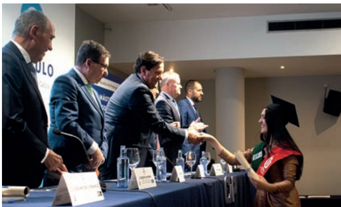
Todos los egresados recibieron la felicitación personal de todos los miembros de la mesa presidencial