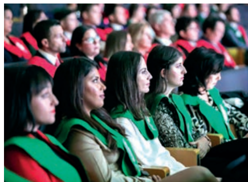
Perspectiva de egresados del CEF.- y la UDIMA