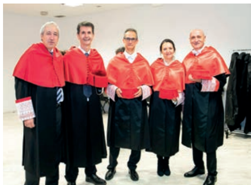
Posado de doctores en Derecho de la UDIMA

Un aprendizaje que representan los 464 egresados y que supone un logro fruto de ese esfuerzo, y que la propia rectora de la UDIMA, Concha Burgos, celebró «no solo por su conocimiento adquirido, sino por su resiliencia y capacidad de superación» ante las adversidades. Durante su discurso, la rectora argumentó a favor del papel de la universidad como fábrica de intelectuales, esa figura que desde los tiempos de Pericles en la antigua Grecia, hasta nuestros días con Jonathan Swift, ha criticado el poder político y se ha mostrado idealista.