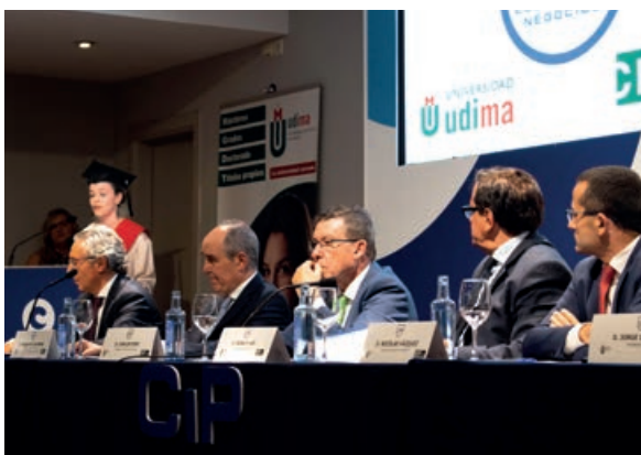
Mesa presidencial del acto